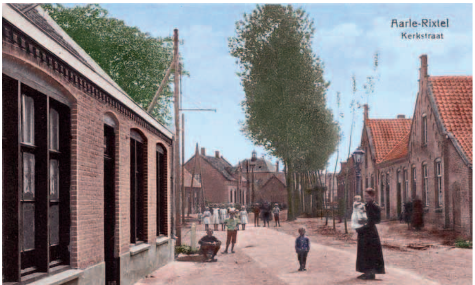
De Kerkstraat in Aarle-Rixtel rond 1910.

Het buitenechtelijk kind, dat van zijn moeder de naam Pieter Verkuijl gekregen had, moest geëcht worden. Dit gebeurde via de trouwakte, welke in 2 juni 1825 in Aarle-Rixtel werd opgemaakt. In de