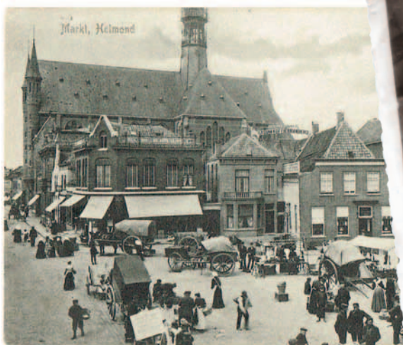
In de Heilige Hartkerk aan de Veestraat hing een ingelijste foto van de heilige Lucia Filippini, altijd voorzien van witte bloemen.