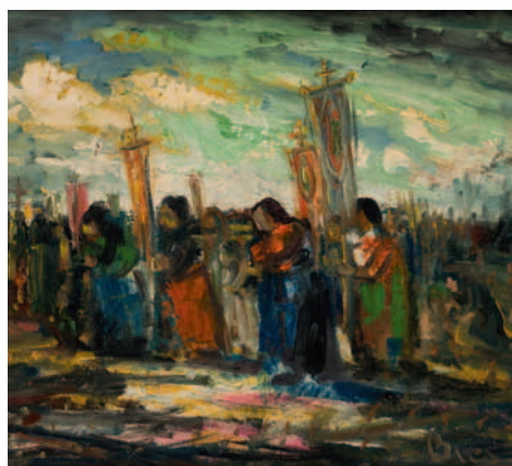
Veldprocessie, circa 1960, olieverf op paneel, 50,5x 61 cm. Particuliere collectie

Het reizen heeft hem goed gedaan. Hij pakt de draad weer op. Natuurlijk blijft hij landschappen schilderen.