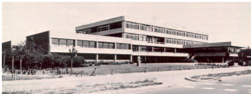
Het Knippenbergcollege in Helmond, omstreeks 1977.

nr. 105247.