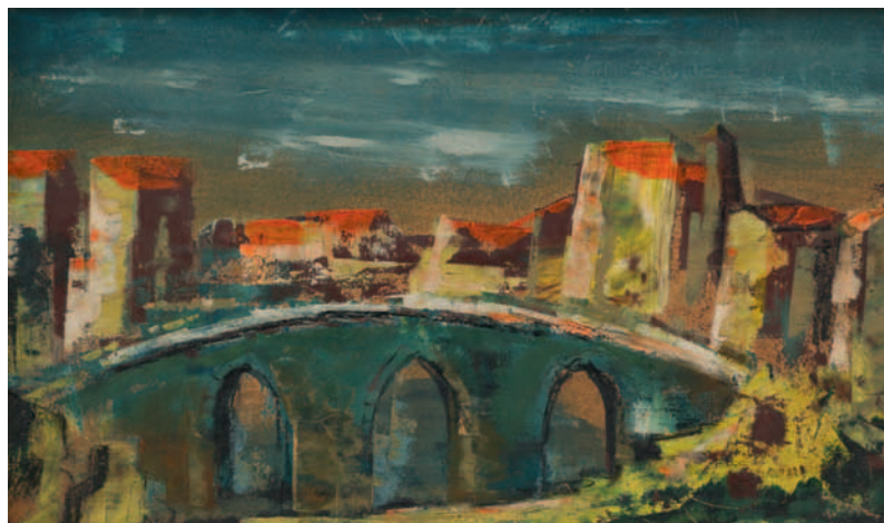
Boogbrug, circa 1955, olieverf op paneel, 30x50 cm. Galerij-Museum Bies, Aarle-Rixtel

de grauwe Peel herschappen is tot een vruchtbaar landbouwgebied, zo evolueert het sombere palet van Bies naar lichtere tonen.” In 1964 bezoekt Marinus ook nog de Leiestreek en Sint-Martens-Latem, en natuurlijk het Constant Permeke Museum in Jabbeke. De schilder van de Peel heeft zijn weg naar het zuiden gevonden.