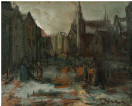
Straat in Amsterdam, circa 1960, olieverf op paneel. Galerij-Museum Bies, Aarle-Rixtel