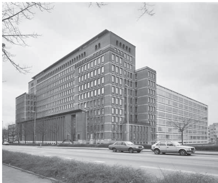
Foto van het voormalige Rijksbelastingkantoor in Amsterdam, met links het oorspronkelijke gebouw van Rijksbouwmeester Friedhoff en rechts de 'moderne' uitbreiding van Bolten.

Overheidsgebouwen, ook die van de Belastingdienst, werden tot in de jaren zestig ontworpen en gebouwd door de Rijksgebouwendienst. Deze dienst stond onder leiding van een rijksbouwmeester en stelde zelf architecten en bouwkundigen te werk. Later werkte de dienst ook samen met externe