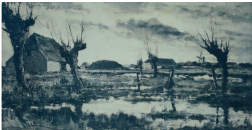
Peellandschap, aangeboden aan veldmaarschalk Bernard Montgomery in 1945.