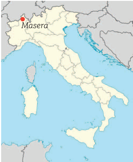
Masera in de regio Piëmont.