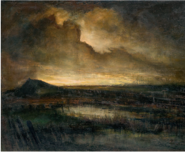
Peellandschap bij avond, circa 1956, olieverf op doek, 98x122 cm. Galerij-Museum Bies, Aarle-Rixtel

Marinus ontwikkelde zijn eigen stijl mede geïnspireerd door de Vlaamse Expressionisten.