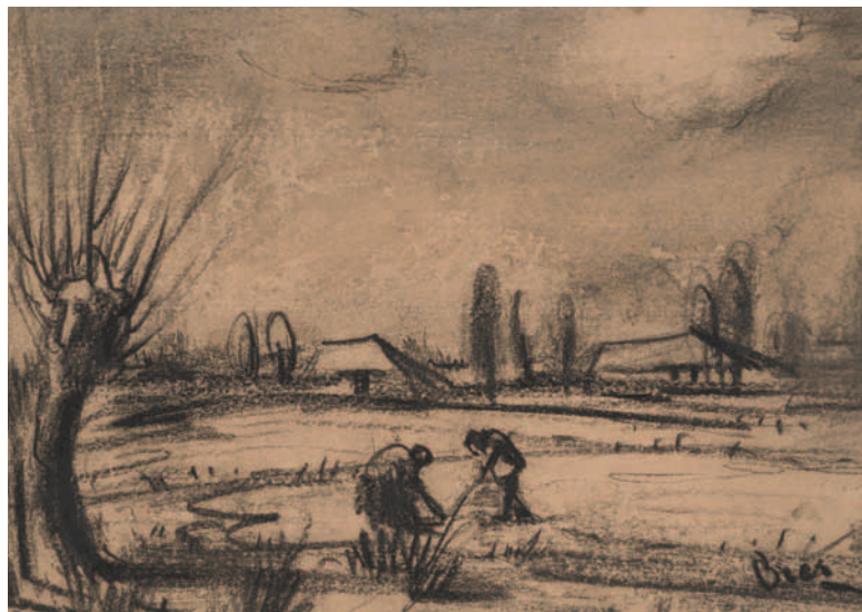
Boer en boerin op het land, circa 1948, krijttekening, 19x27 cm. Galerij-Museum Bies, Aarle-Rixtel