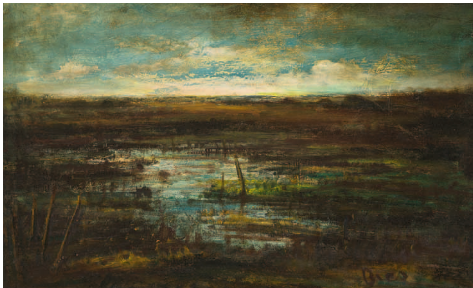
De Peel, circa 1963, olieverf op doek, 40,5x60,5 cm. Galerij-Museum Bies, Aarle-Rixtel

Marinus wijdt zich volledig aan de schilderkunst. Hij schildert veel, bestudeert kunstboeken, is geïnspireerd door de schilders van de Haagse School en bezoekt andere kunstbroeders zoals de Helmondse schilder Sjef van Schaijk en de fotograaf Martien Coppens uit Lieshout. Ook komt hij in contact met de Vlaamse expressionisten, met Constant Permeke als centrale figuur, een kunstenaar voor wie hij veel respect heeft. De Vlaamse expressionisten, die zich vooral in de jaren 1920-1930 lieten zien, zijn sterker dan hun internationale tijdgenoten, gericht op authenticiteit en gebruikten bij voorkeur sombere aardkleuren. Hun kunst was overwegend figuratief en verhalend van aard.