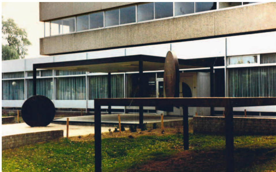
Het kunstwerk 'De Cent' van Kees Verschuren bestond uit vier delen. Twee munten stonden bij de ingang van het belastingkantoor, een munt stond binnen en een achter het gebouw. In 1996 werd het kunstwerk als oud ijzer afgevoerd door de nieuwe eigenaar van het kantoor.

de Marijkeweg 24 in Wageningen, dat in 2011 is verbouwd tot appartementen. Wel zijn beide gebouwen typerend voor de kantoorarchitectuur van de jaren zeventig. Deze wordt gekenmerkt door een sterk horizontale geleiding met verticale vensterassen, samengestelde bouwmassa's die zweven op kolommen, en een robuuste uitstraling. De gevels bestaan veelal uit bandvensters en betonnen of stenen gevelplaten. Voor de afwerking wordt ruw beton of natuursteen gebruikt. Ornamentiek en enige speelsheid ontbreken. Qua locatie staan de panden meestal niet in het stadscentrum maar op industrieterreinen bij verkeersknooppunten met afdoende parkeerruimte. In Helmond was dat de nieuwe Kasteel- Traverse die werd geflankeerd door grote, moderne kantoor- en woongebouwen