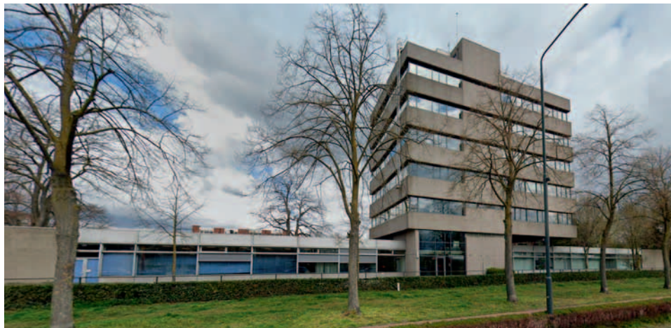
Foto van het belastingkantoor vanuit zuidelijke richting, 2025.

architecten en bureaus. Afhankelijk van de ambities van de rijksbouwmeester kregen interne en externe architecten weinig of veel ruimte voor het uitwerken van hun eigen ideeën. Zo had de eerder genoemde Friedhoff in de jaren veertig en vijftig een uitgesproken - maar maatschappelijk gezien een enigszins achterhaalde - visie op rijksarchitectuur en dienden zijn medewerkers zich daaraan te conformeren; zijn opvolgers ten tijde van het ontwerp van het Helmondse belastingkantoor in de jaren zeventig (te weten de rijksbouwmeesters Frank Sevenhuijsen en Wim Quist) waren daarentegen veel vrijer.