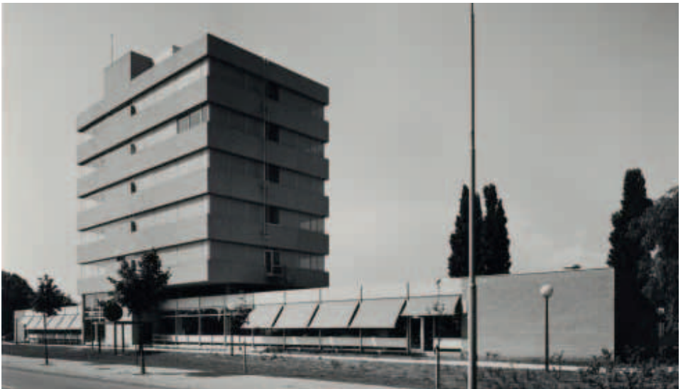
Het belastingkantoor aan de Penningstraat in Helmond, gezien vanaf de Kasteel-Traverse, 1977. Foto: J. van den Broek, collectie: RHCE, nr. 105600

Het pand was het eerste speciaal als belastingkantoor ontworpen gebouw